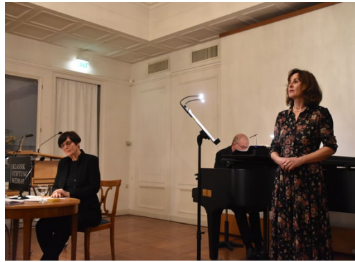
Weihnachtsfeier im Festsaal