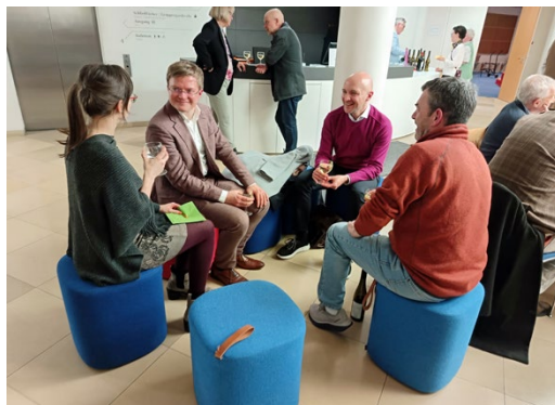
In vertrauten Runden