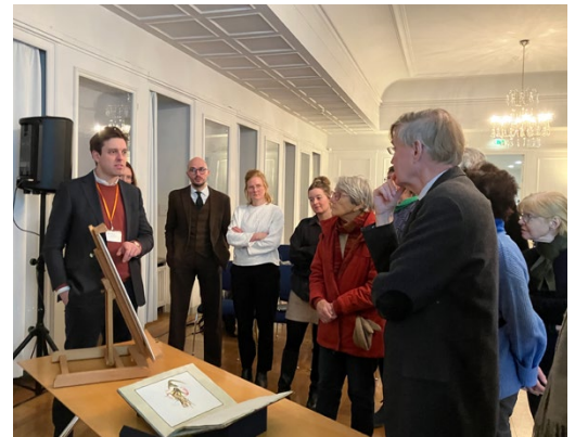
Besichtigung und Diskussion zu Tischbeins Zeichnungen