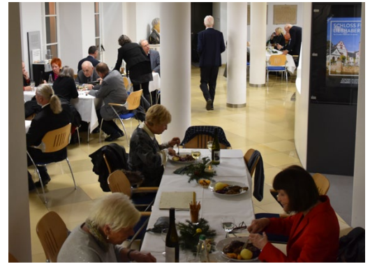
...und im Foyer