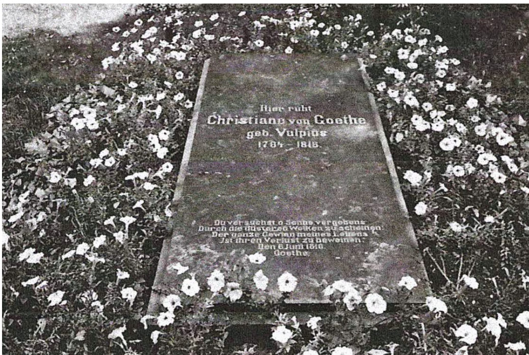
Grab Christiane von Goethes um 1930

1838 erfolgten die ersten Überführungen auf den neuen Gottesacker, so auch das Grab von Herders Frau Maria Caroline, 1839 fiel das erste Mausoleum, 1854 erfolgte der Abriß des Kassengewölbes. Mauern wurden abgetragen, Gräber eingeebnet, wie z.B. das Grab von Josias von Stein, oder das Grabfeld der Familie Vulpius und das Grab von Christiane von Goethe. Neue Straßen sind durch den alten Friedhof angelegt worden, so die heutige Straße Am Jakobskirchhof, die Verlängerung der Friedensgasse und die Vergrößerung des Rollplatzes.