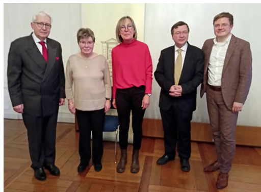
Neuer und alter Vorstand