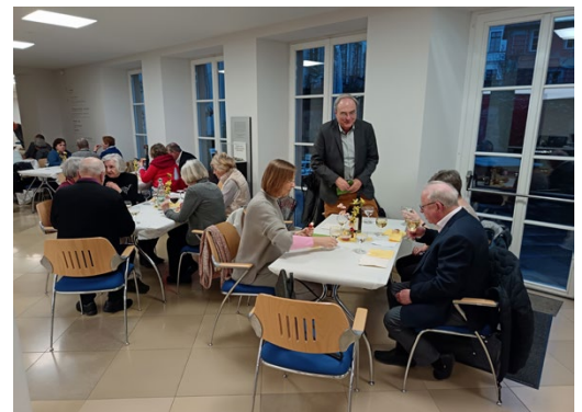
Diskussionen und gemütlicher Ausklang nach der Jahreshauptversammlung