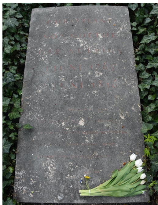
Grabplatte im heutigen Zustand