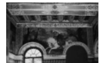
Wandmalerei nach Goethes Werken