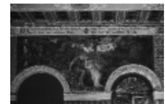
Wandmalerei nach Goethes Werken