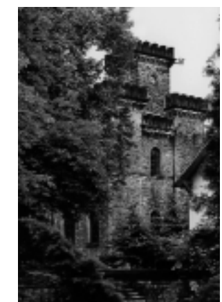
Schöne Höhe bei Dittersbach

Schnappschüsse von der Exkursion nach Dittersbach und Stolpen am 16.06.2001