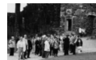
Vor der Burg Stolpen und den „Stolpischen Basalten“