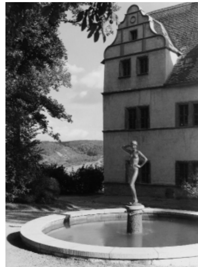
Der Brunnen vor dem Renaissance-Schloß in Dornburg Foto: M. Boerner, 1962

Die geistigen Vorarbeiten an der Brunnenplastik begannen bereits 1958. „Mein Mädchen für den Brunnen der Dornburg-Schlösser ist fertig modelliert“, teilte sie dem Auftraggeber am 5. September 1958 mit. Herr Zehrfeld, „vielbeschäftigter Former aus Dresden“, goß das Gipsmodell, die