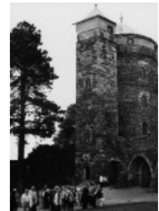
Vor dem „Coselturm“ der Burg Stolpen