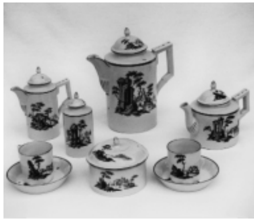
Service für Kaffee, Tee und Schokolade mit Architekturlandschaften in Schwarzlotmalerei Thüringen, Eisenberg, um 1800

Alle Stücke sind im Zeitgeschmack mit inselartigen Landschafts- und Architekturfragmenten in Schwarzlot staffiert, einer